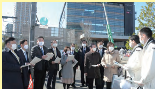
駅前再開発事業を視察しました!!