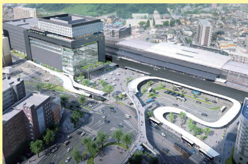
熊本駅白川口駅前広場全体イメージ