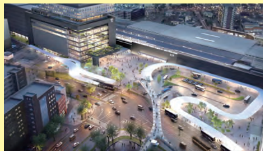
熊本駅白川口駅前広場イメージ(夜)