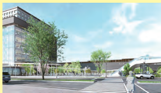
熊本駅白川口駅前広場イメージ(春)

「アミュプラザくまもと」をはじめ、結婚式場やホテル、シネマコンプレックス、立体庭園などがあります。