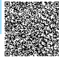
【要望書全文はコチラ】